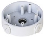
PFA139 Монтажная коробка